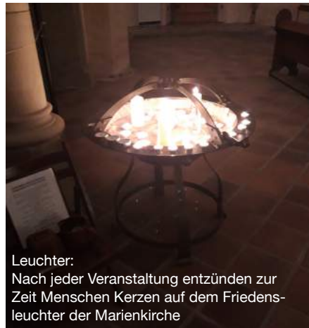
Leuchter: Nach jeder Veranstaltung entzünden zur Zeit Menschen Kerzen auf dem Friedens- leuchter der Marienkirche